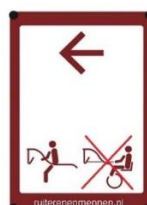
Afb 4. Menners geen toegang

Als een bepaalde groep bij uitzondering geen toegang heeft wordt dit met een kruis aangegeven, zie afb 4.