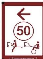
Trajectbord met herinneringsnummer

Bij een afstand groter dan 2 km tussen twee knooppunten is een herinnering aan te bevelen met een knooppuntnummer toegevoegd. Hierdoor is steeds bekend naar welk knooppunt men onderweg is.